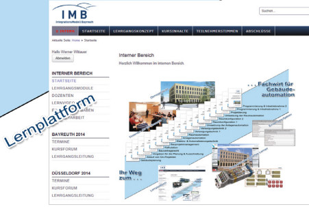
Die Konzeption wurde von der Universität Bayreuth und dem IMB-Institut erarbeitet.